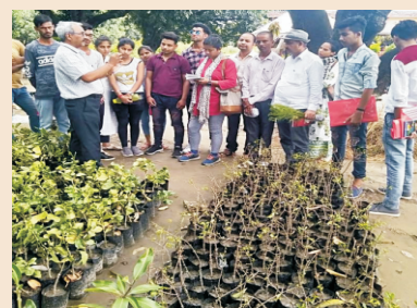
शोध केन्द्र का भ्रमण करते प्रशिक्षणार्थी