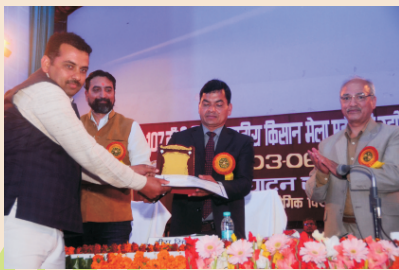
प्रगतिशील कृषक को सम्मानित करते मुख्य अतिथि

किसान मेला के उद्घाटन अवसर पर उत्तराखण्ड के नौ प्रगतिशील कृषकों को कृषि के क्षेत्र में अभिनव परिवर्तन लाने एवं उल्लेखनीय सफलता प्राप्त करने के लिए मुख्य अतिथि द्वारा प्रतीक चिन्ह एवं प्रमाण-पत्र देकर सम्मानित किया गया, जिनका विवरण निम्नवत् है।